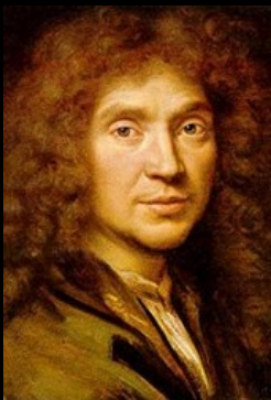
Molière (1622 1673)

En 1680, les acteurs de la troupe de l'hôtel de Bourgogne et ceux de l'hôtel Guénégaud, sont réunis par ordonnance du roi Louis XIV pour fonder la troupe de la Comédie-Française. C'est précisément le 25 août 1680 que les comédiens inaugurent cette réunion par une représentation non pas d'une œuvre de Molière mais en choisissant l'œuvre que Racine tenait pour la plus aboutie de ses tragédies, "Phèdre" .