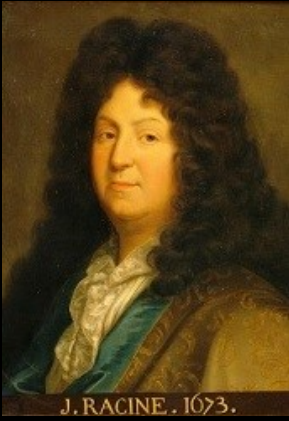
Jean RACINE (1639 1699)