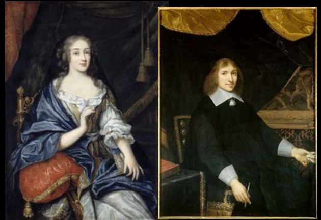
Louise de la Vallière

La seconde partie voit l'amour grandissant de Louis XIV pour Louise de La Vallière puis sa lutte contre le superintendant Fouquet soutenu par Aramis commandant de l'ordre des jésuites.