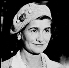
Coco Chanel (1883 1971)

Cette petite fille précoce, au caractère et aux idées bien trempées, tiendra ses promesses. Née en 1908, elle devient, dans le Paris des années 1950, le symbole de la femme libre, revendiquant sa place d'écrivain aux côtés des grands intellectuels d'après-guerre.