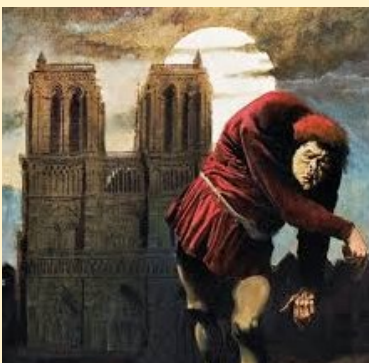
Image de grâce et de pureté surgie de ce cauchemar, la bohémienne Esméralda danse pour le capitaine Phoebus et ensorcelle le tendre et difforme Quasimodo, sonneur de cloches de son état. Pour elle, consumé d'amour, l'archidiacre magicien Claude Frollo court à la damnation.