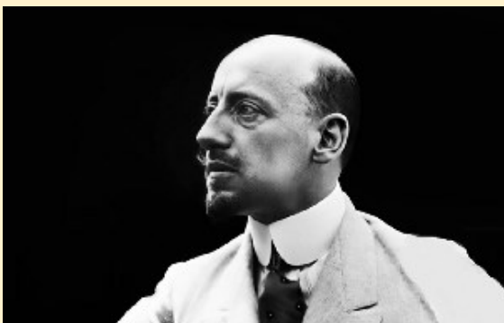
Gabriele d' Annunzio

Maurice Barrès , trop vieux pour participer à la guerre, il est resté l'un des maîtres à penser de la droite nationaliste durant l'entre-deux-guerres.