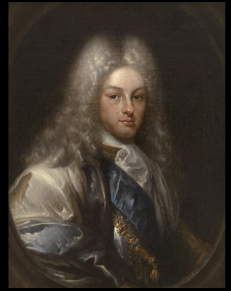
Philippe V d'Espagne

À la fin du XVIIe siècle, Charles II, roi d'Espagne chétif, malade et impuissant est le dernier héritier de sa dynastie. Toute l'Europe se bat alors en coulisses pour capter son héritage. Franck Ferrand revient aujourd'hui sur un vaste retournement diplomatique qui a marqué la fin du règne de Louis XIV.