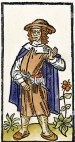
Ly comence le grant codicille a te flamēt maistre francois Villon

Interprétations : Serge Reggiani Monique Morelli Bernard Lavilliers Gérard Philippe