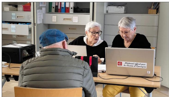
Les permanences du mardi matin rompent aussi l'isolement de certaines personnes âgées.

Bibliothèque sonore à la salle Marie-Mauron de la médiathèque Jacques-Duhamel (41, rue Robert Schuman). Entrée libre. Permanence le mardi de 9 h 30 à 11 h 30. Tél. : 06.83.94.53.29. Site internet : https://lesbibliothequesonores.org/835 . Mail : 83s@advbs.fr